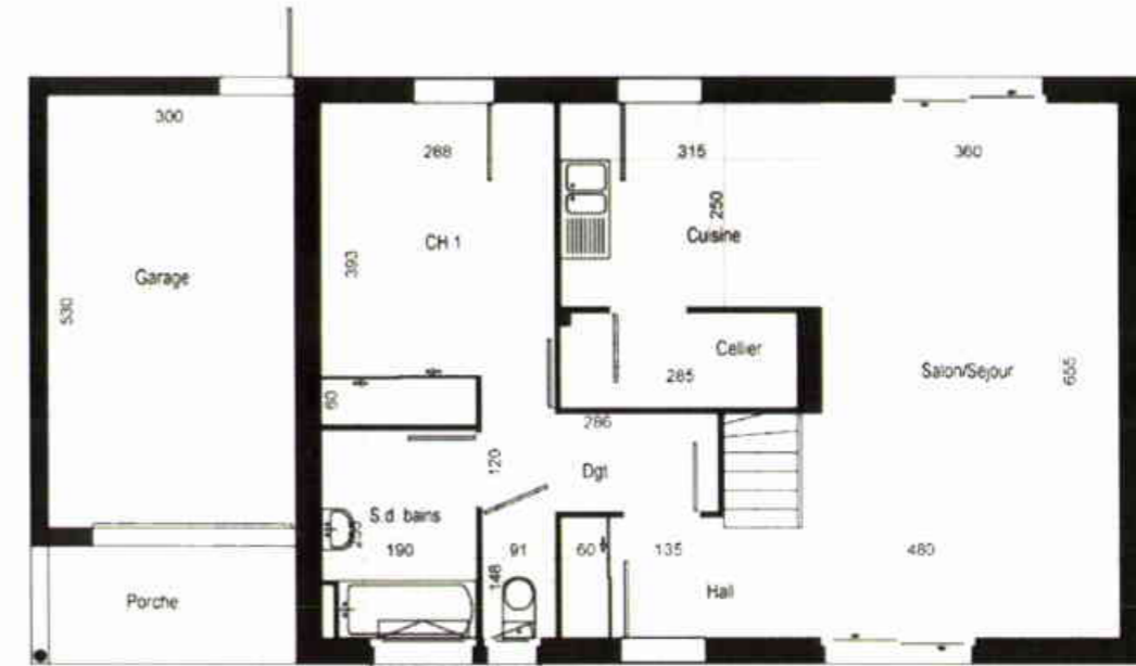
Plan du R-d-C